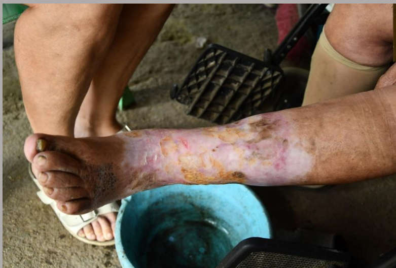
Pierna izda. 2017 2023