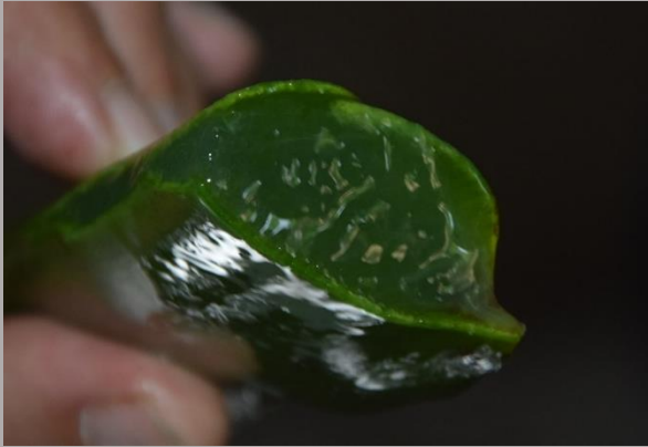
Sábila o aloe vera