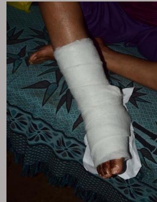
Venda de guata