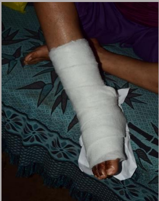
Sujeción y protección con venda de guata.