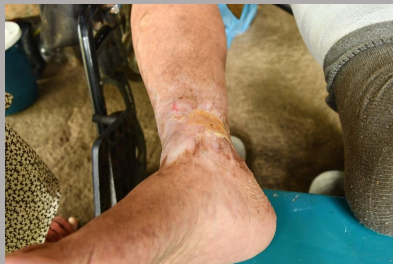
Pierna drcha. 2017 2023