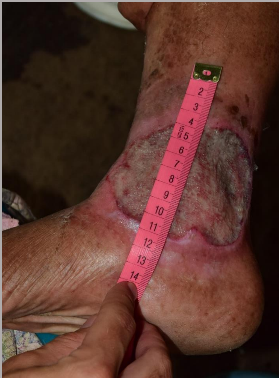
Pierna derecha vertical