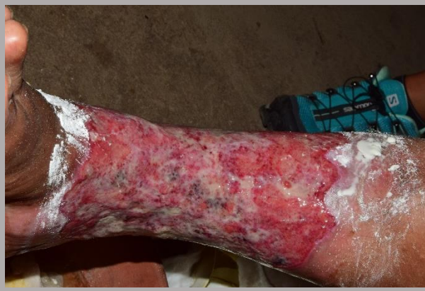
Eventual aplicación de maicena