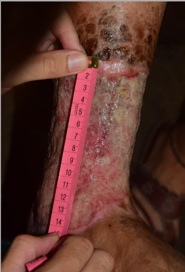
Pierna izquierda maleolo interno