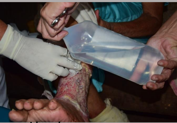
Limpieza con suero o agua hervida