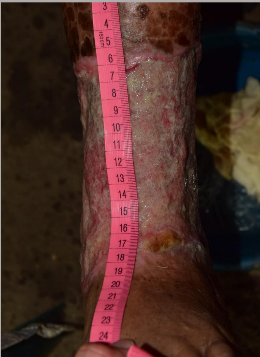
Pierna izquierda antetibial