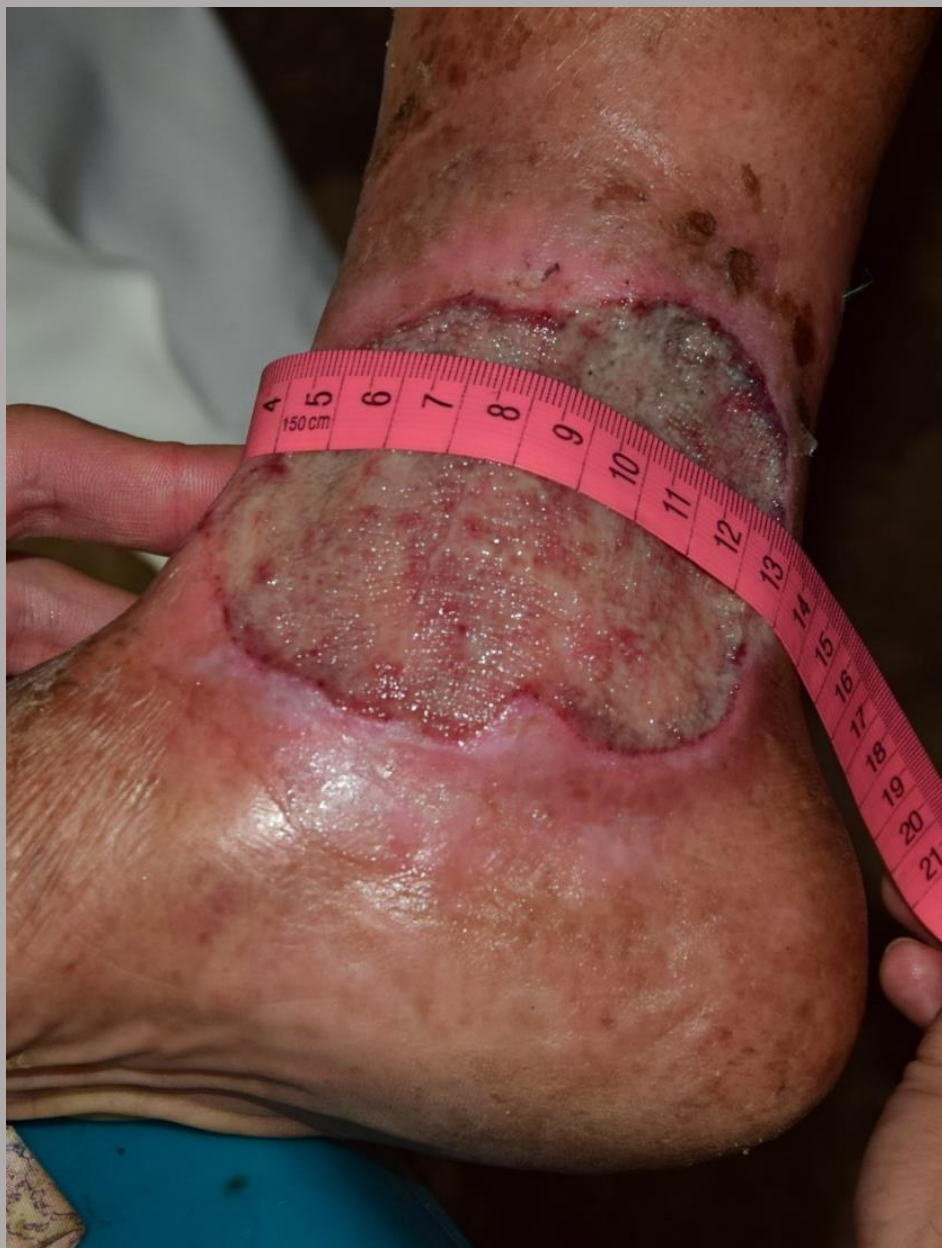
Pierna derecha horizontal