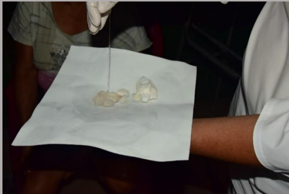
Sábila en el foam