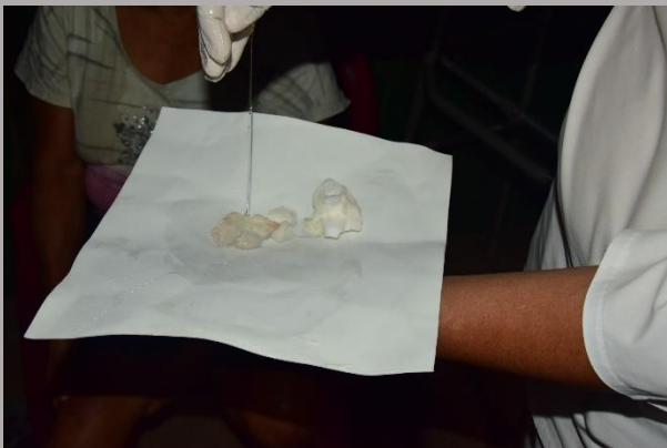
Sábila en el foamy