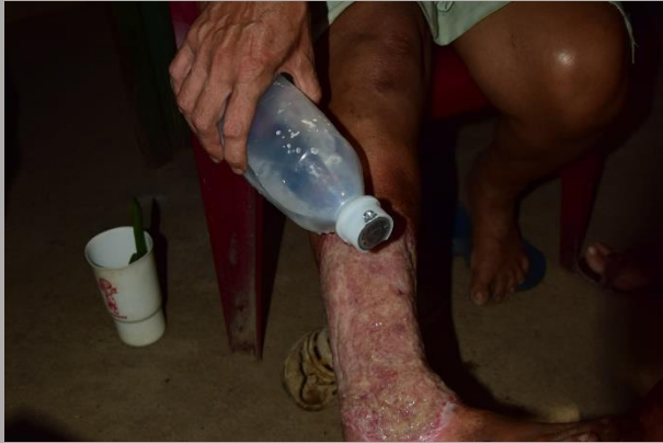
Suero o agua hervida