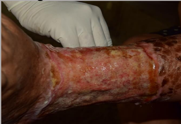
Aplicación de sábila